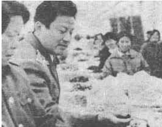
东营市工商局东营分局针对消费者反映的干货市场掺杂使假情况,进行突击专项检查,共查获各类掺杂干货10余种,500余公斤,价值4万余元。图为检查人员在认真细致的检查。