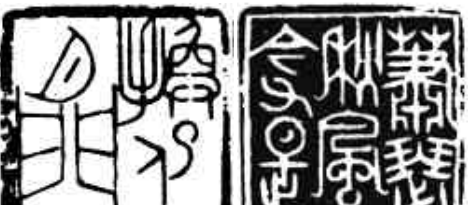
萧瑟秋风今又是(右) 换了人间(左) 毕顺先篆刻